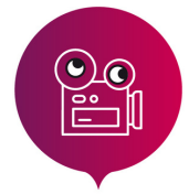
LA FABRIQUE MUSIQUE ET IMAGE