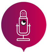
LA FABRIQUE À CHANSONS