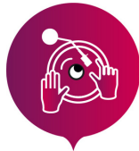
LA FABRIQUE ELECTRO