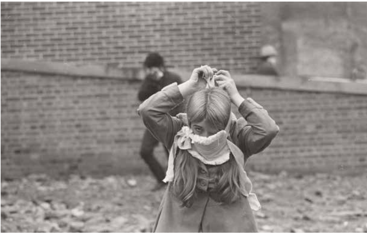
Gilles Caron, Manifestante républicaine, Derry, Irlande du Nord, août 1969 © Fondation Gilles Caron / Clermes