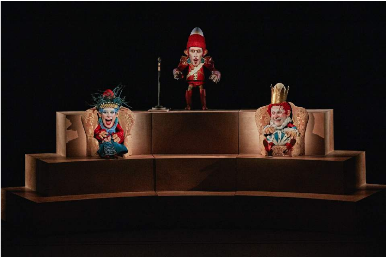
C. Hecq, V. Lesort, Le Voyage de Gulliver