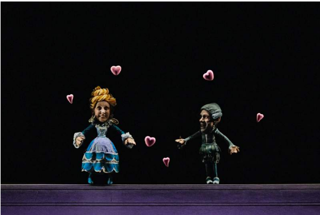
C. Hecq, V. Lesort, Le Voyage de Gulliver