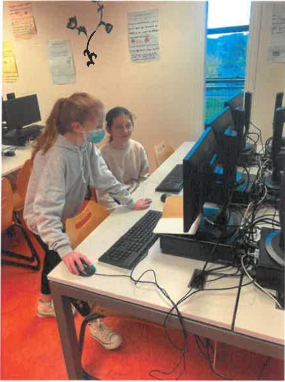
Dessin du plateau