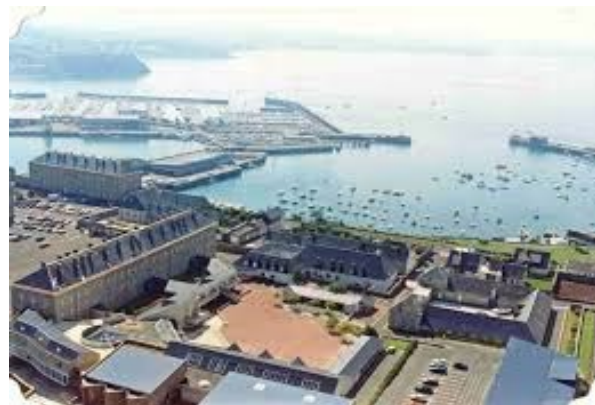
Vue sur la mer depuis la cantine

Atelier relais rattaché au CLG André Malraux, Granville; situé dans une zone géographique exceptionnelle.